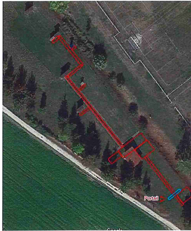
Figure 1 : Stabilisation du terrain pour l'accès « handicapé », délimitée par les traits rouges

Présentation du projet d'aménagement d'un pas de tir couvert à Foicy :