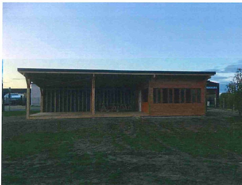
Figure 4 : Exemple du pas de tir couvert d'Arcis

Le projet d'aménagement du terrain de Foicy a été transmis à la Mairie : en attente de réponse. Le projet sportif est soumis au vote de l'assemblée qui l'approuve à l'unanimité.