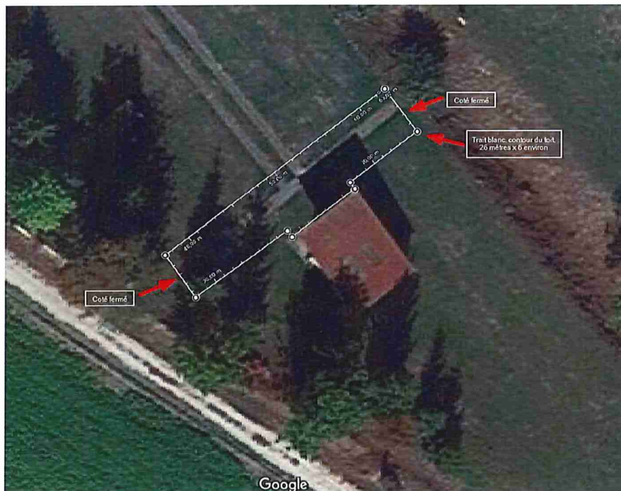
Figure 2 : Emprise de la toiture du pas de tirs